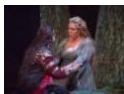
Seattle Opera Presents The Ring: Das Rheingold